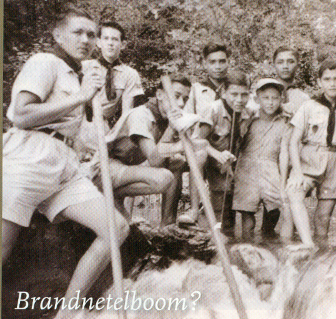
Padvindersgroep, Hollandia circa 1952

Paradijsvogels en kroonduiven Indische Nederlanders in voormalig Nieuw-Guinea Door Tjaal Aechterlin KIT publishers: 160 pagina's (hardcover) ISBN: 9789460220494 Prijs: € 24,50 Verschijnt maart 2010