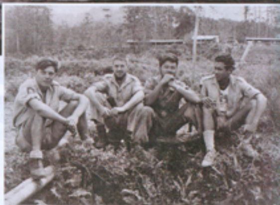
Mariners (Ferry rechts) tijdens de voorbereidingen voor de expeditie naar het Sterrengebergte, Nieuw-Guinea 1959

De Digoel versmalde voorbij de bestuurspost Tanah Merah. Op de zandbanken lagen krokodillen te luieren in de zon. Krijgshaftig uitziende Asmat roeiden – rechtopstaand – in lange, uitgeholde boomstammen voorbij.