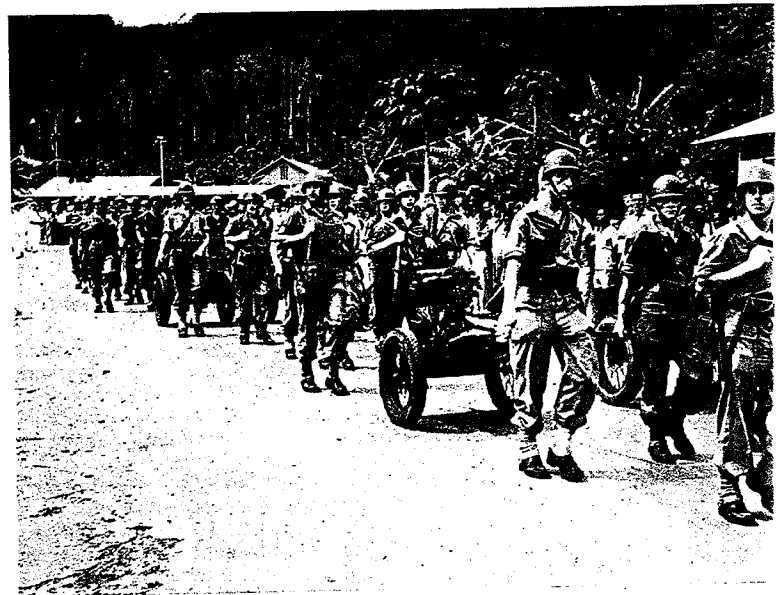
Mariniers op parade te Hollandia.

De vaartuigen worden bovendien met de modernste installaties uitgerust, o.m. met een Decca survey set.