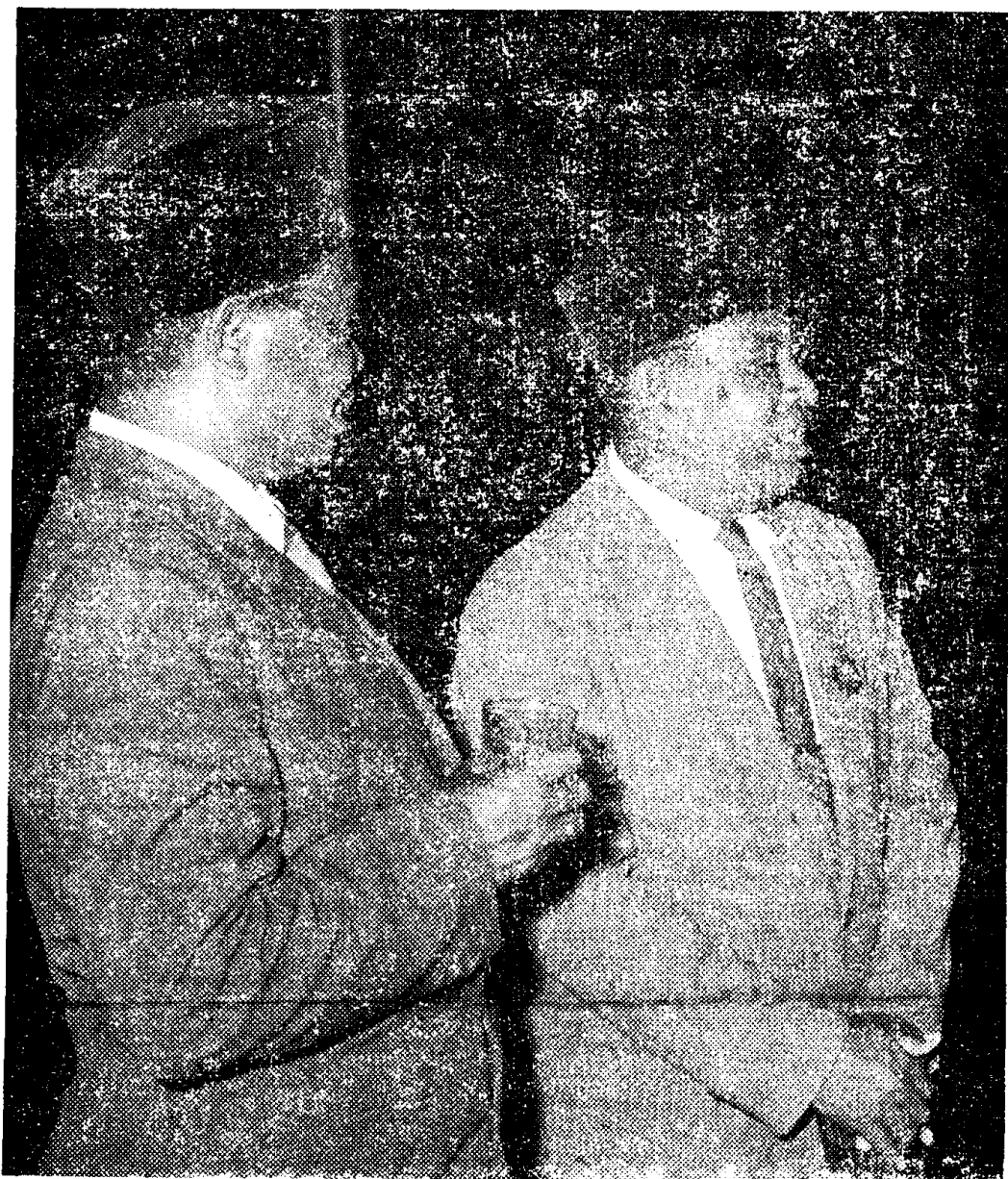
Twee belangrijke adathoofden te Fakfak, van terzijde gefotografeerd tijdens een ontvangst. Links de radja van Fatagar en rechts die van Roembati.

BLIKJE: Ja, dat zit 'm in die duizenden cartons AMSTEL BIER die telkens gelost worden.