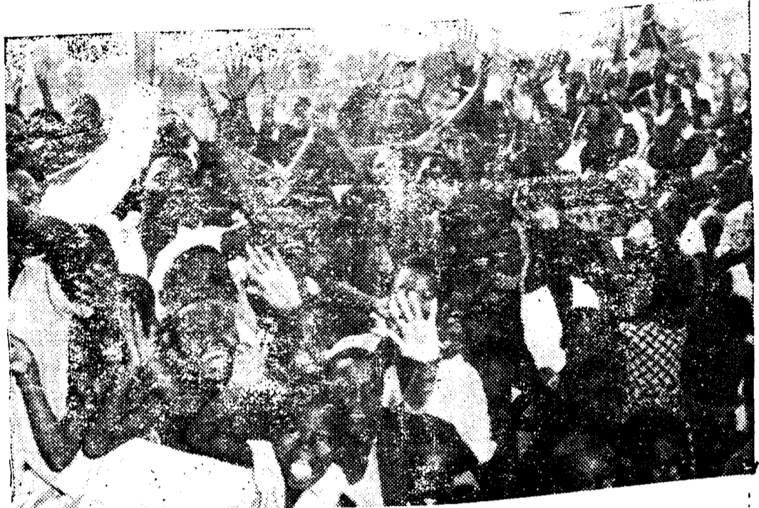
Deze Kongolese jongeren zijn wild enthousiast over de pas verkregen onafhankelijkheid. Wellicht hebben zij inmiddels gemerkt dat het besturen van een land een moeilijke zaak is.

Gisteren is in Rotterdam de nationale vlootweek geopend met een defilé van mariniers en vlootpersoneel voor het standhuis. Aan de vlootweek wordt deelgenomen door de kruiser de Ruyter en zeven andere Nederlandse oorlogsbodem. De Britse marine is vertegenwoordigd met het fregat Wakefull, terwijl de Duitse bondsmarine 5 motortorpedobootjagers heeft afgevaardigd. Tijdens de vlootweek worden vele manifestaties en demonstraties gegeven. Ook voor de jeugd die kikkvormannen van de Kon. Marine in actie kan zien.