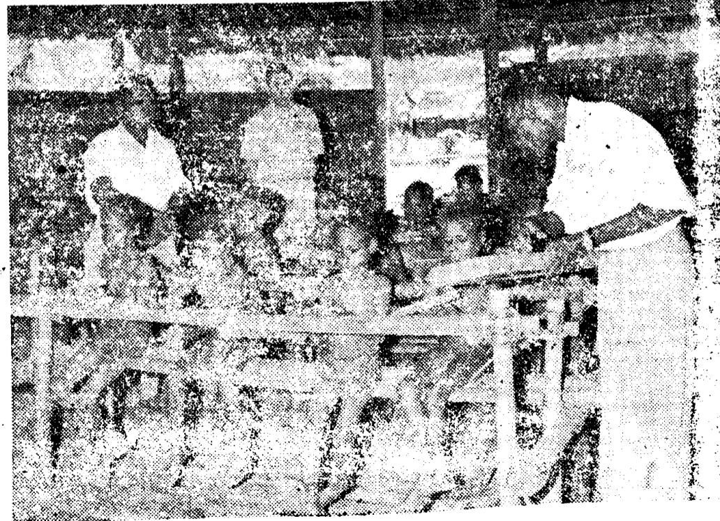
Het onderwijs komt in Nieuw Guinea meer en meer in het centrum van de belangstelling te staan. Het is dan ook in hoge mate bepalend voor de toekomst van het land.

Een dergelijk verzoek is gedaan aan de machtige Sojo arbeiders federatie, die echter geen commentaar heeft willen leveren alvorens er een formeel verzoek is gedaan.