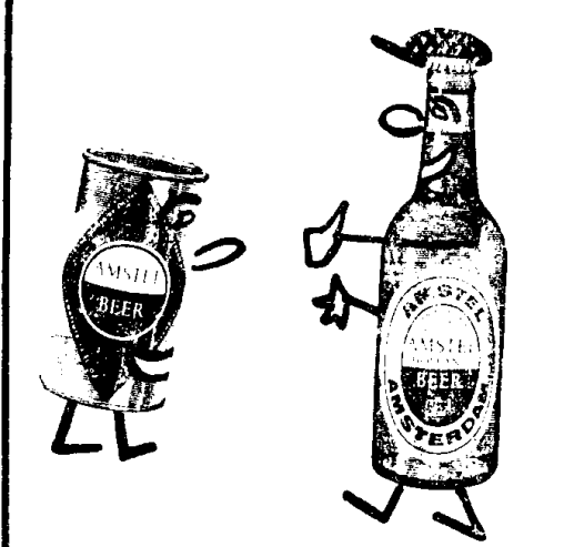
FLESJE: "Wat verneemt jij van de S..."