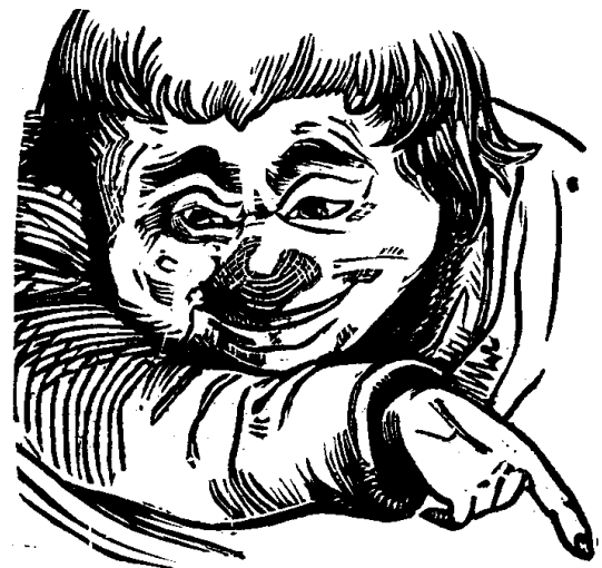
HOLLANDIA IS ANDERS. . .