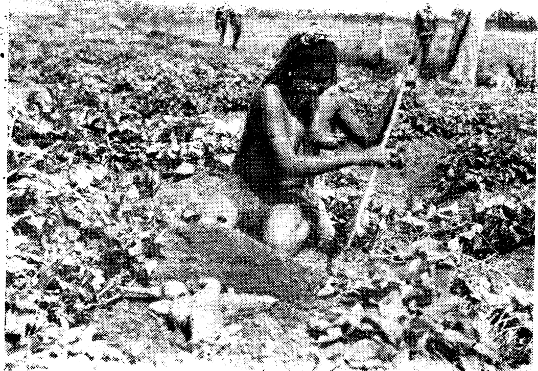
Oorlog en landbouw zijn belangrijkzaken in de Baliem. Jammer genoeg beschikken we niet over een foto van het oorlogsbedrijf. Daarom hierboven een afbeelding van een Dani-schone, bezig met het oogsten van zoete aardappelen.

Over de door minister Soebandrio aan Nederland toegedachte agressieve bedoelingen verwees de woordvoerder naar de op 4 oktober van dit jaar door minister Luns in de assemblee der Verenigde Naties uitgesproken rede, waarin werd gezegd: "dat mijn land op enigerlei wijze agressieve bedoelingen teneen zien van Indonesië zou hebben, is een zo fantastische gedachte, dat ik mij niet kan voorstellen, dat enig verstandig mens daar geloof aan kan hechten."