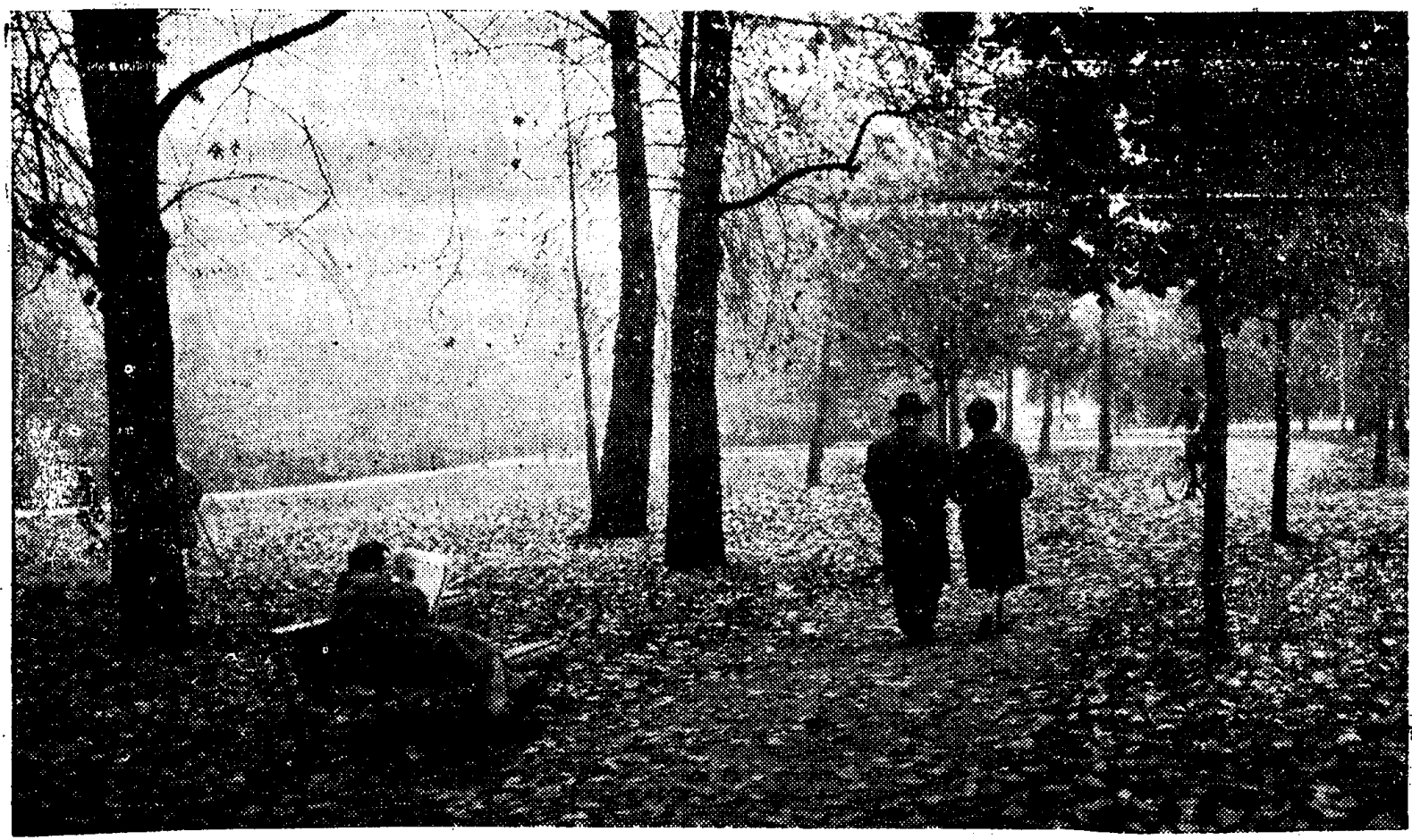
Dit is een foto voor aanstaande verlofgangers: Herfst in Nederland.

De politieke beweging in de huidige wereld die de positiefste kanten heeft en het meest vooruitstrevend is, vindt men niet in de communistische landen, en evenmin in het grensgebied tussen de vrije en de onvrije wereld, maar in