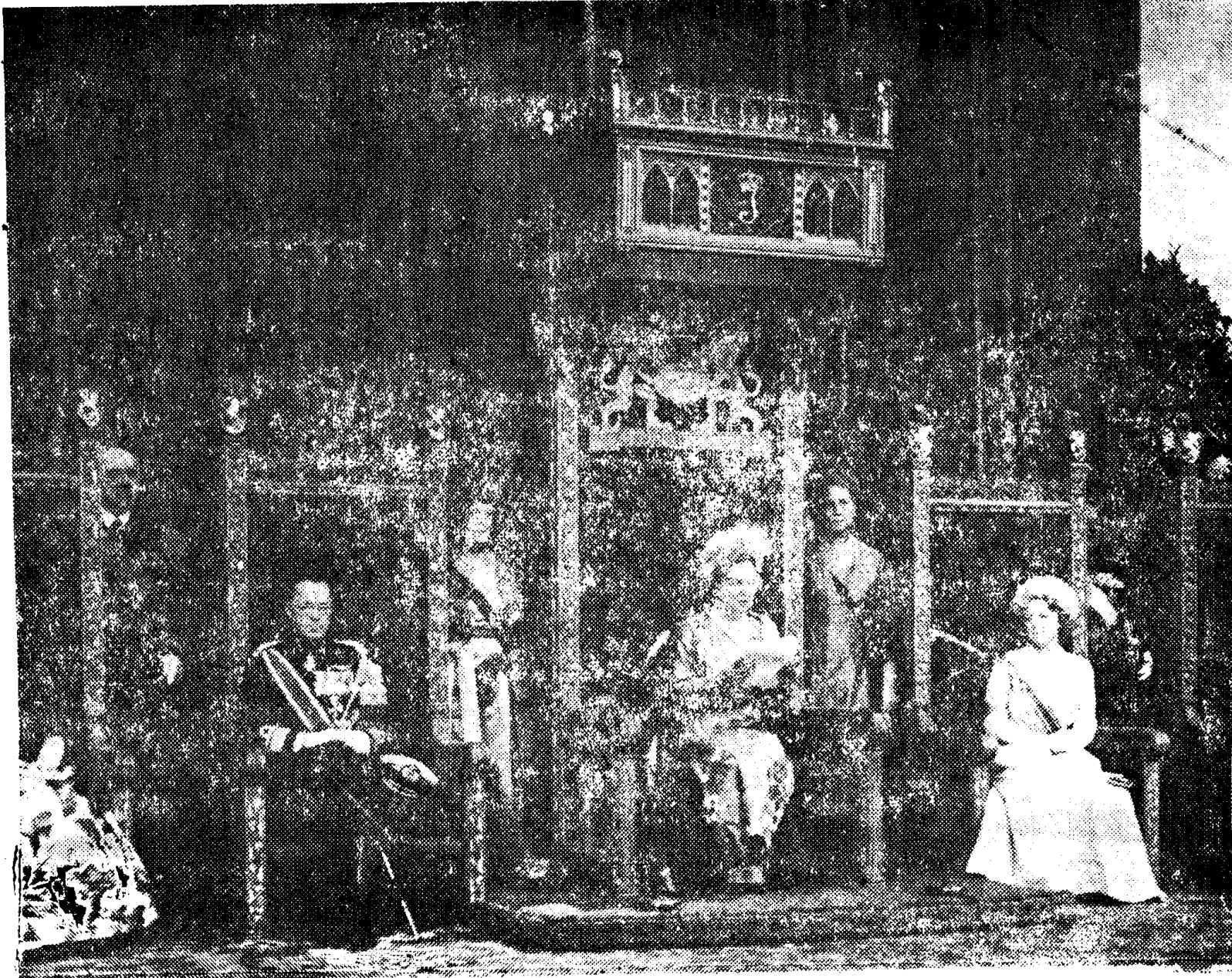
Op de derde dinsdag in september wordt door een toespraak tot de regering en de leden der Staten Generaal een nieuwe parlementair jaar geopend. H.M. de Koningin tijdens de troonrede met links Z.K.H. de Prins en rechts van H.M. H.K.H. de Prinses Beatrix 19 september 1962 WALCO - plasticdienst