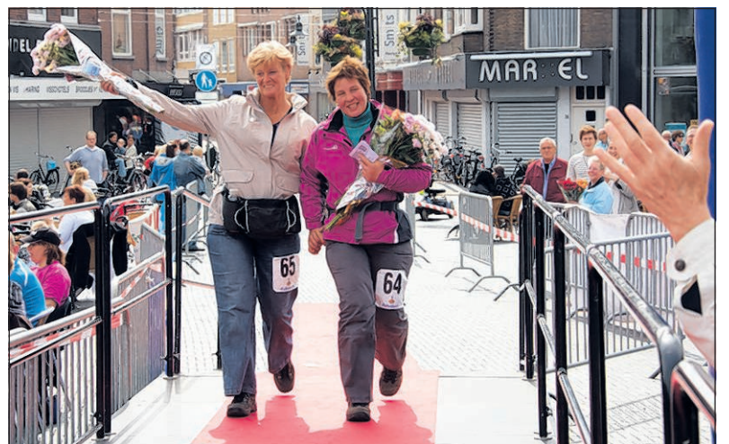
De 80 van Oosterhout stond bij wandelaars hoog aangeschreven, vanwege de goede organisatie.