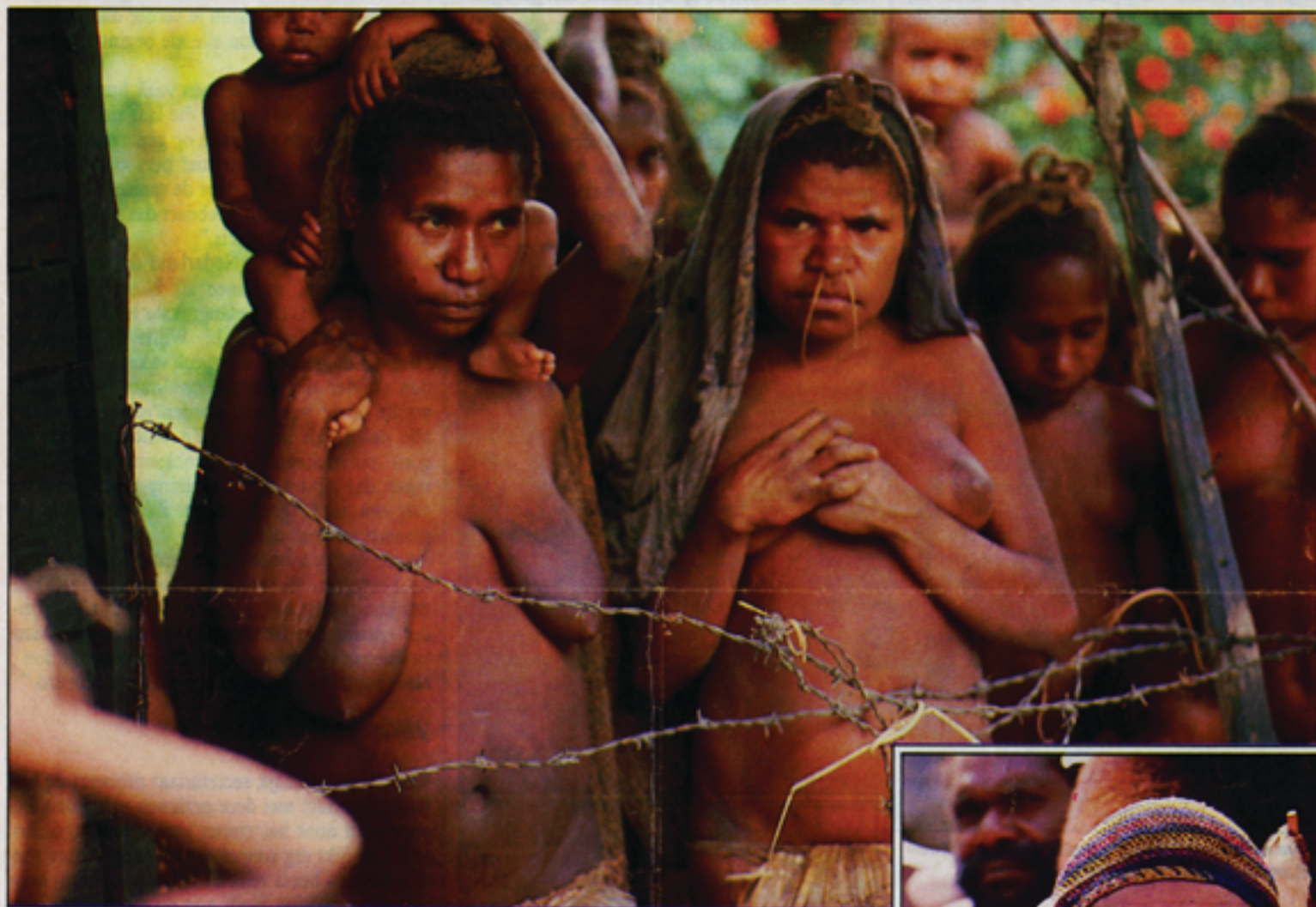
Papoeavrouwen in de Pass Valley, diep in het binnenland van Irian Jaya bij de herdenking van 25 jaar zendingswerk in deze vallei. Hier maakte de tv-ploeg opnamen voor „Een Hollandse erfenis, Irian Jaya.”

Het binnenland van Irian Jaya, voormalig Nederlands Nieuw-Guinea, is voor journalisten een gesloten gebied. De Indonesische overheid voelt niet veel voor pottekijkers. Met een 8-millimetercamera trok een ploeg voor de VA-