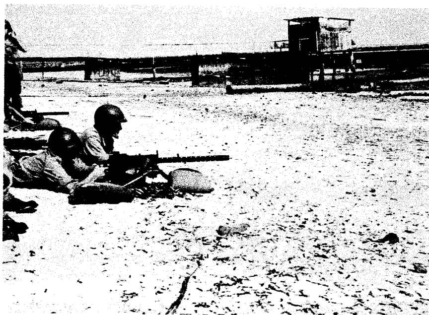
VERDEDIGING MARINIERS OEFENEN MET MITRAILLEURS OP EEN STRAND IN NEDERLANDS-NIEUW-GUINEA Circa 1960.

duidden. Tevergeefs. In de Verenigde Naties was zijn missie steevast stukgelopen op de Amerikanen, met al hun cliëntelastaten. Op de afstandelijke Republikeinse president Eisenhower en zijn moraalridder op Buitenlandse Zaken Dulles had hij nooit vat gekregen.