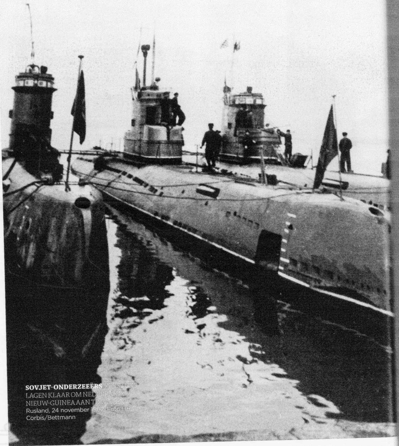
SOVJET-ONDERZEEËRS ZES STUKS LAGEN KLAAR OM NEDERLANDS NIEUW-GUINEA AANTEVALLEN Rusland, 24 november 1962.