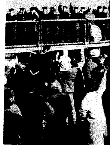
AFSCHEID FAMILIELEDEN ZWAA- DE MATROZEN VAN DE EVERTSE UIT BIJ HUN VERTREK NAAR NIEUW- GUINEA Den Helder, 1961.

In 1977 dook het verhaal opnieuw op, dit keer veel steviger gedocumenteerd. Voor zijn boek Morgen, bij het aanbreeken van de dag. Nederland driemaal aan de